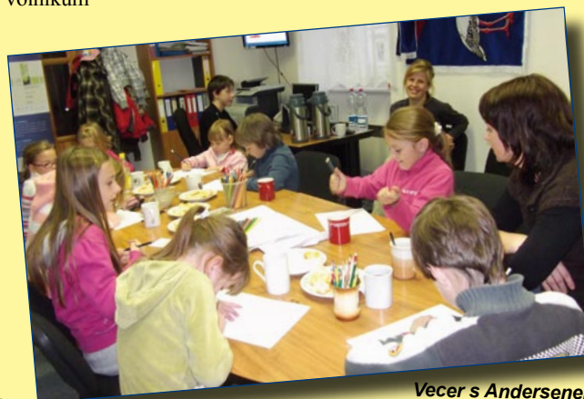
Večer s Andersenem. Děti při hře na ilustrátory

Oslavy Vítání léta proběhly jako každoročně na louce u myslivecké odchovny Na Buchtě. Kromě tradičních disciplín byla letos připravena i jedna novinka – navlékání provrtaných víček od PET lahví na provázek. Soutěže provázelo horké slunečné počasí. Program byl doplněn o možnost zadovážet si na skákacím hradu a zakončen klasickým táborákem. Dovolte mi na tomto místě poděkovat těm, kteří nám s organizací disciplín pomohli – myslivcům, sportovcům, baráčníkům, ženám a hasičům z Piština i neorganizovaným dobrovolníkům