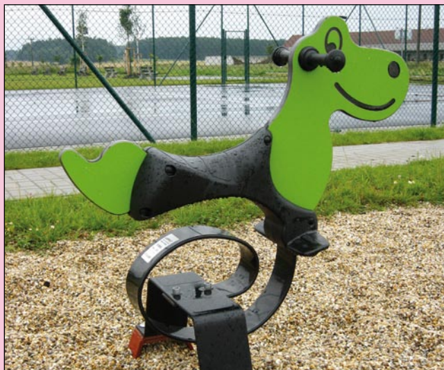
Moderní a ergonomické houpadlo pro nejmenší už láká

Zázemí hřiště je uzamčené, v případě potřeby jsou klíče k vyzvednutí u paní Gabriely Vlaskové (Markové), Češnovice 98.