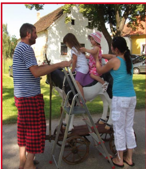
Děti se svezly na netradičním povozu