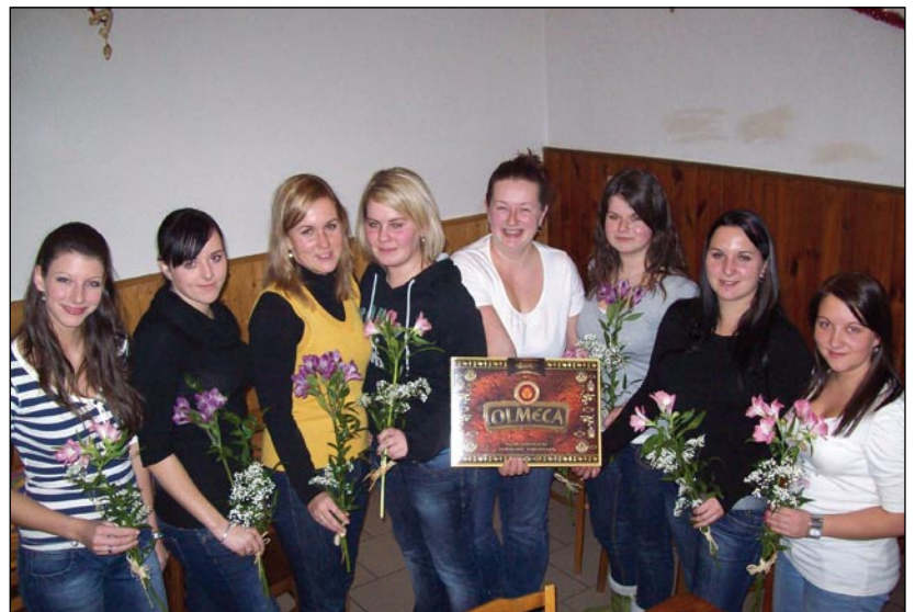
Členky soutěžního družstva žen z Češnovic na výroční schůzi sboru v konci roku 2011