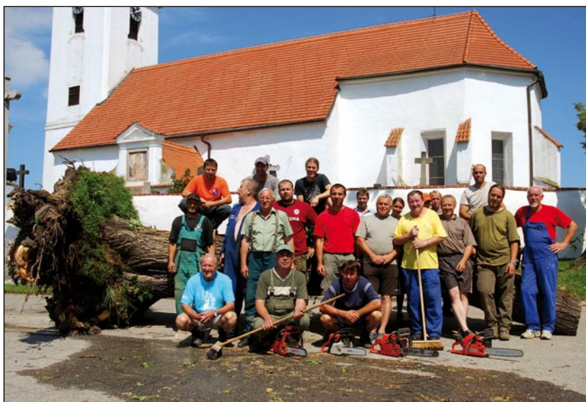
Parta našich chlapů, kteří se pustili s vervou sobě vlastní do likvidace škod. Po skončení zapózovali na památku před torzem starého kmenu.