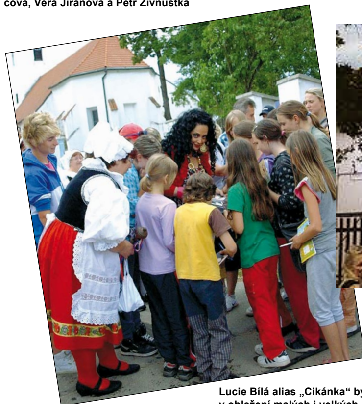
Lucie Bílá alias „Cikánka“ byla stále v obležení malých i velkých návštěvníků