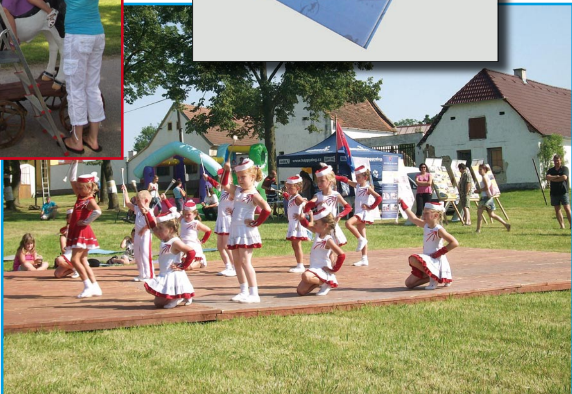
Vystoupení hlubockých pidiprinzeziček