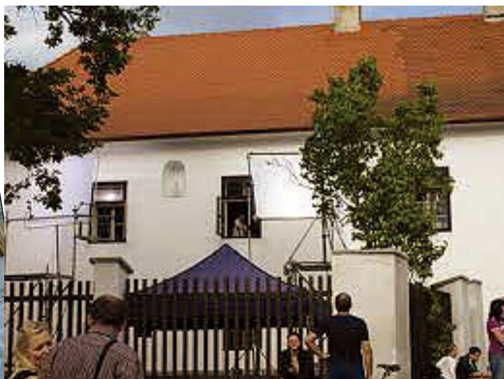
Pištiná fara se stala středobodem natáčení v Pištině a zažila po mnoha letech zaslouženou pozornost v přítomnosti známých herců. Ve filmu bude vystupovat jako fara babovřeská.