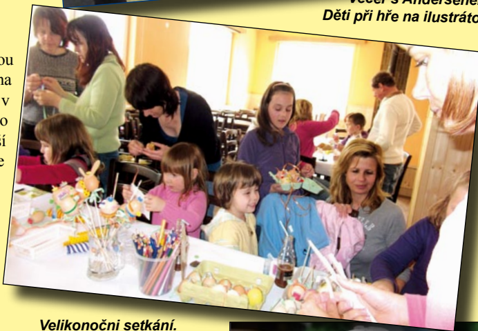
Velikonoční setkání. Do zdobení vajíček se zapojily děti i jejich maminky.