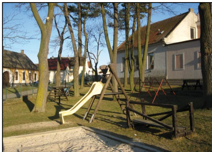
Na místě stávajícího hřiště v Pištěni vyrostou nový moderní prostor pro cvičení a zábavu dětí a seniorů.

Z dalších větších akcí bych mohl jmenovat také realizaci části protipovodňových opatření v Češnovicích, a to úpravy povodí v extravilánu obce. Tuto část by mělo realizovat povodí Vltavy na vlastní náklady. Ani ostatní čtyři stavby tohoto projektu se rovněž nezastavily, pokračujeme ve shánění peněz na jejich realizaci, ale to není úkol vůbec jednoduchý, při tom jaký je stav státní poklad-