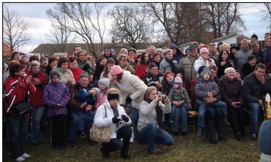
Diváci po shlédnutí představení v bývalé farské zahradě v Pištině