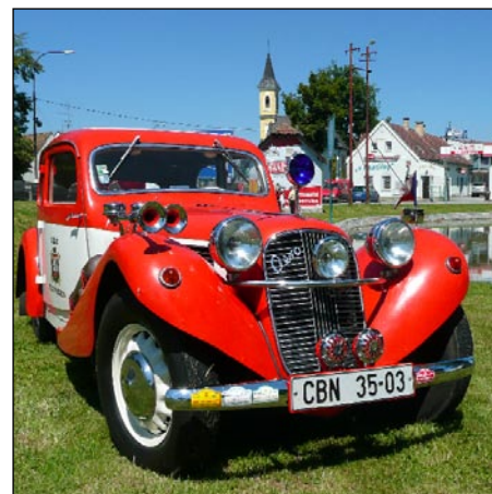
Jeden z vystavených veteránů.

zpřístupněno všech pět výstav. V motelu U Kapličky vystavoval Ondřej Caletka fotografie starých Češnovic,