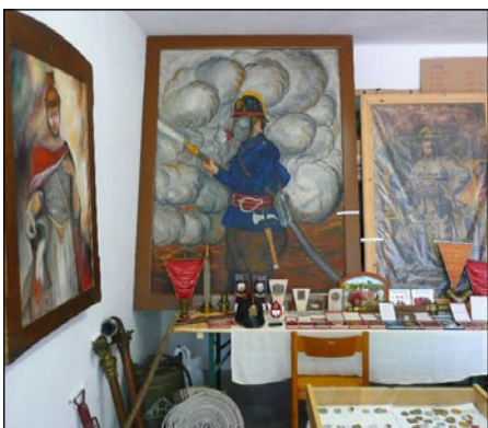
Vystavené exponáty budily pozornost.

podium pro hudebníky, na kterém později koncertovaly dvě pozvané dechové kapely. Objevili se i stánkaři s nejrůznějším pouťovým zbožím, cetkami, potravinami, medem,