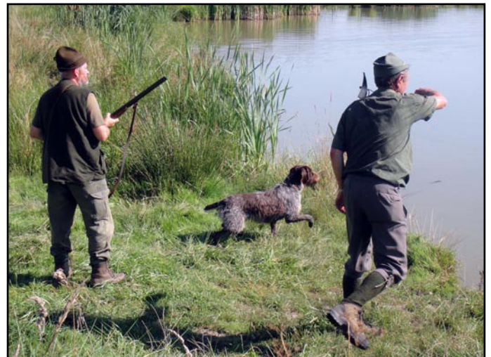
Aportování je pro ohaře jednou z nejpříjemnějších činností.