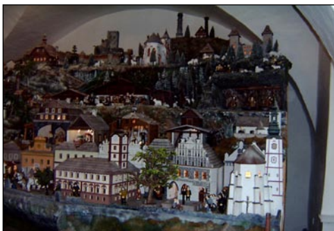
Betlém v muzeu v Sušici

První zastávkou letošního výletu bylo Muzeum Šumavy v Sušici. Muzeum se pyšní např. archeologickými sbírkami. Seznámíte se tu s nálezy ze slovanického pohřebiště datovaného do 11. století. Pohřebiště Prasušičanů se nacházelo na místě s příhodným názvem „V Ráji.“ V sousedství archeologické expozice je umístěna novinka muzea. Je to velký mechanický betlém s rozměry 5 x 3,5 x 2,8 m a rozlohou přes 16m 2 . Vytvořili jej v r. 2004 místní