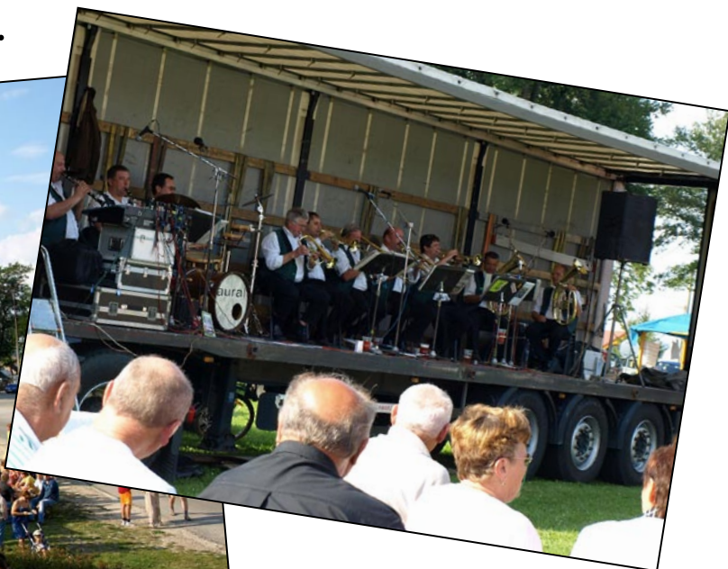
Diskotéka pro dříve narozené pod taktovkou populárních Babouček.