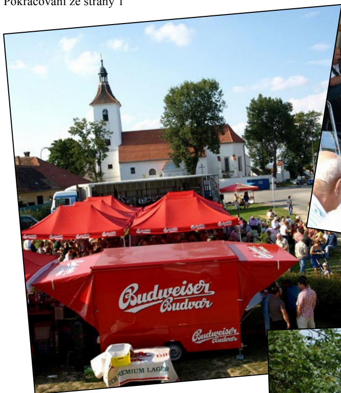
Celkový pohled na pišínskou návěs plnou gurmánů nad světoznámým mokem