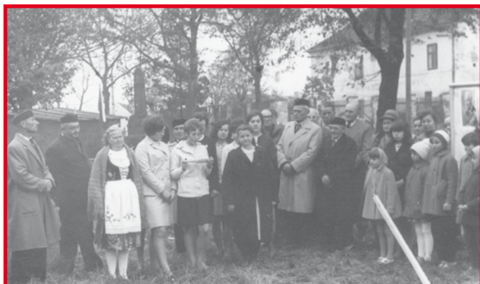
Účastníci slavnosti z roku 1968 naslouchají textu, který byl následně uložen ke kořenům lípy.