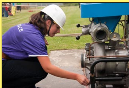
Chvilke napjatého soustředění

V Češnovicích toho dne své umění předvedlo celkem 24 soutěžních družstev, což je v historii této soutěže počet zatím nejvyšší