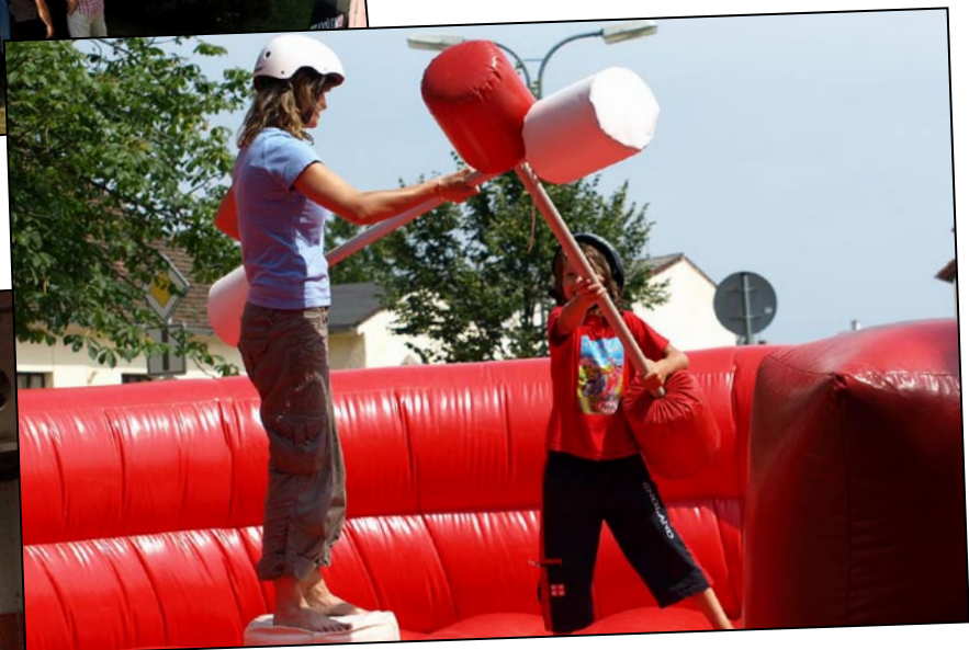
Děti si prožívaly napínavé souboje a o legrační pády nebyla nouze.