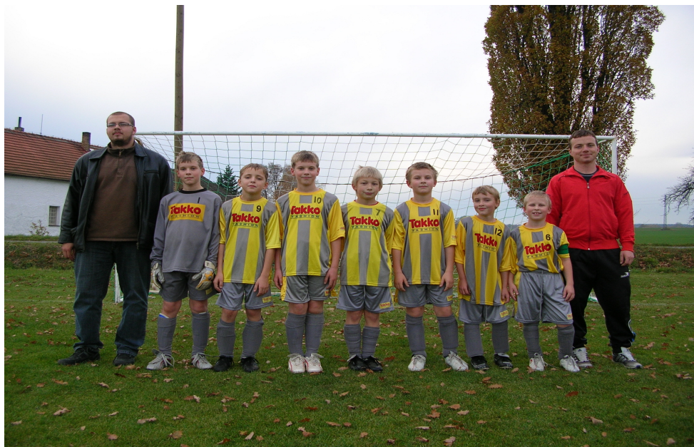
Družstvo starší přípravky před posledním zápasem proti Novým Hodějovicím.

V družstvu mužů přestali v nové sezóně nastupovat dva z posledních tří hrajících našich mladých odchovanců, takže věkový průměr sestavy v některých zápasech se blížil sestavám družstev starých pánů. Muži se v podstatě celý podzim potýkali s problémy spojenými s úzkým kádrem, přestože se do týmu podařilo zapojit dva naše dorostence, kteří vinou nepřihlášení dorostu nesehnali pro tuto sezónu jiné angažmá. Výsledky a výkony v jednotlivých zápasech mužů byly velice nevyrovnané a přes některé dobré výkony proti favoritům soutěže jako např. v Neplachově a proti Vltavě, se mužům nepodařilo bodovat v zápasech proti soupeřům z dolní poloviny tabulky, z nichž mrzí zejména domácí porážky s Úsilným a Chrášťanami. Podzimním výsledkem našich mužů v A skupině III. třídy je po 14 odehraných zápasech 9. místo s 16 body za 4 výhry, 4 remízy a 6 porážek, s celkovým skóre 19:26.