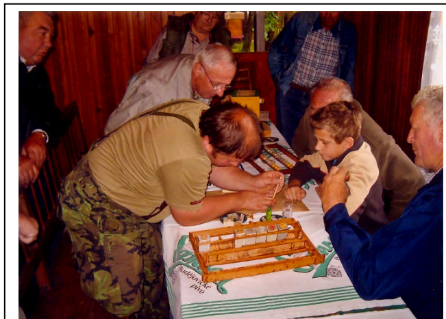
Kurz chovu včelích matek na Picině.