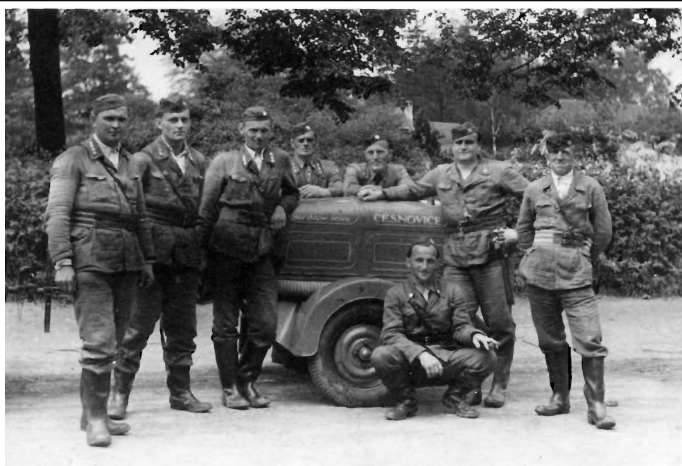
Soutěžní požární družstvo Češnovic z roku 1952