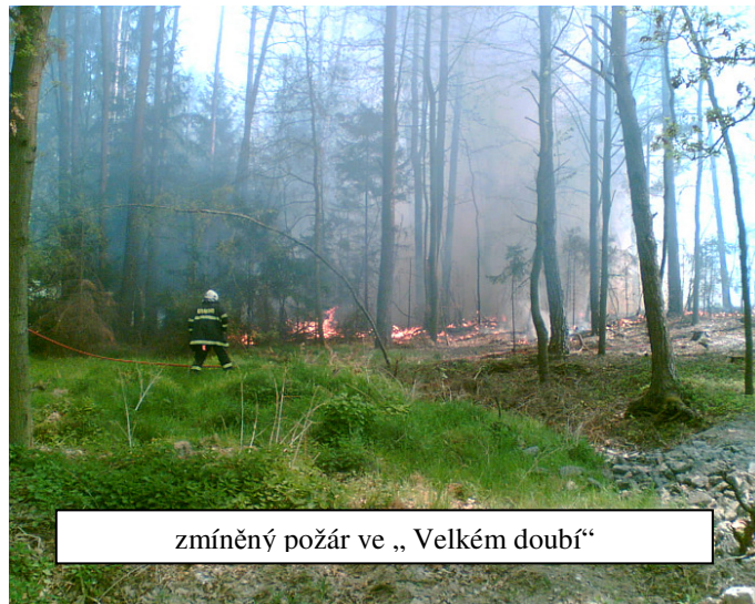
zmíněný požár ve „Velkém doubí“

Náš sbor se při zásahu věnoval pouze pomocným činnostem, protože velká vzdálenost požáru od vodního zdroje neumožnila našim technikům podílet se na hašení požáru.