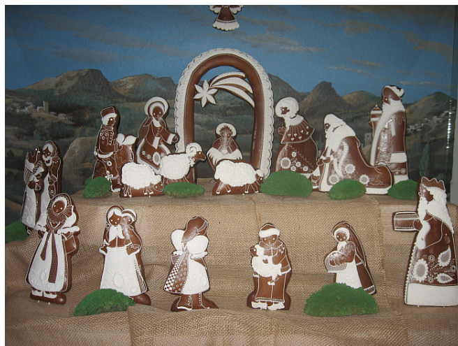
Jeden z mnoha perníkových betlémů