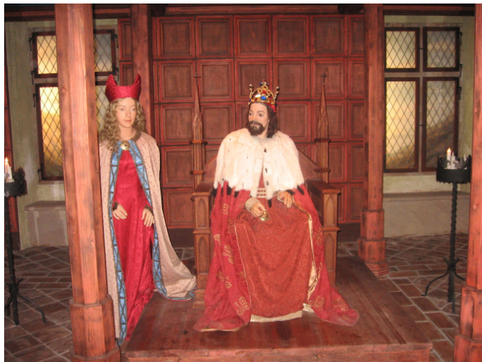
Měli jsme štěstí, sám pan král byl přítomen

Knihovna v Pištině se těší na své čtenáře v pondělí od 16 do 18 hodin. Knihovna v Češnovicích je pro Vás otevřena v úterý od 18 do 19 hodin.