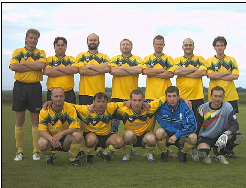
Muži „B“ před zápasem Praktic FC Pištín B – SK Úsilné (12.6.2005).