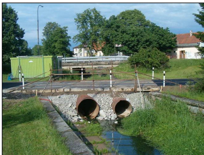
Situace na češnovickém mostě v červnu roku 2005