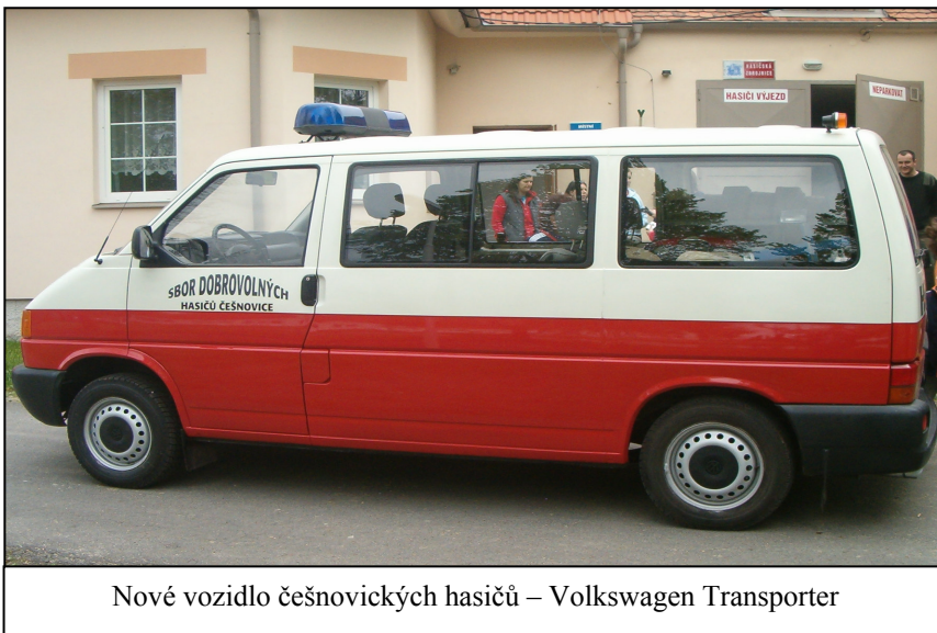
Nové vozidlo češnovických hasičů – Volkswagen Transporter

dostavilo asi 30 místních občanů. Ti s rozpaky sledovali, ze které ze dvou místních hasičáren vyrazí vozidlo Škoda 1203 a do něho urychleně nastoupí zásahová jednotka, která vyrazí do terénu ku pomoci a ochraně tak, jak tomu v minulosti bylo mnohokrát. Napětí rostlo, neboť se zatím nic nedělo, až když směrem od Horánku bylo již zřetelně slyšet