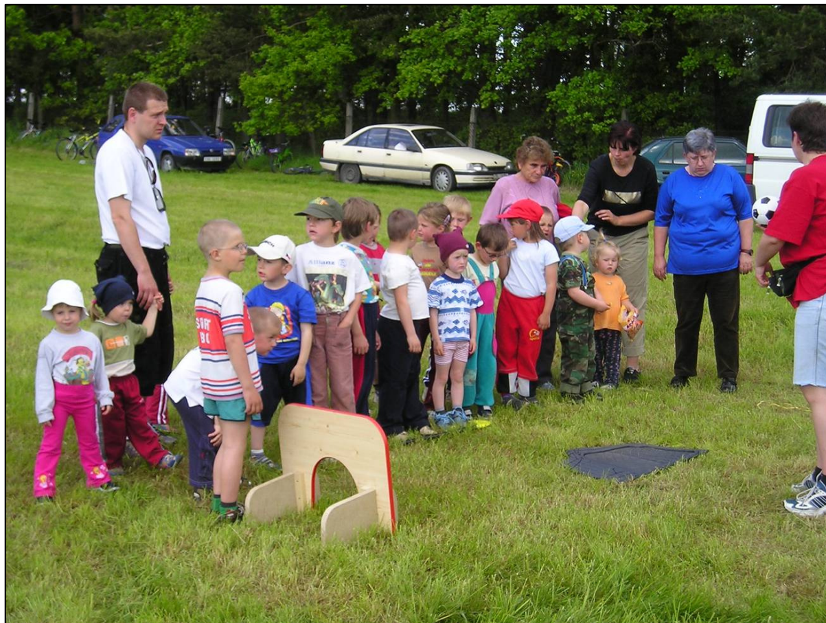
Nejmenší soutěžící na dětském dnu jsou připraveni na další disciplínu – hod míče na terč.