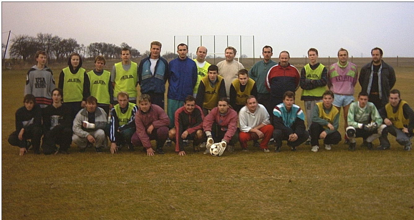
Na fotografii jsou členové oddílu po fotbalovém zápase „Stáří“ – „Mladí“ o podzimní dokopné