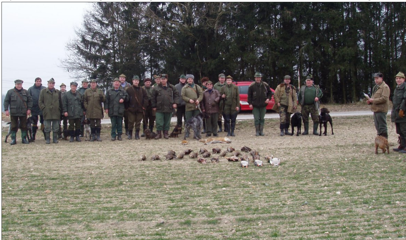
Na fotografii jsou zachyceni členové mysliveckého sdružení při výřadu po jednom z honů.